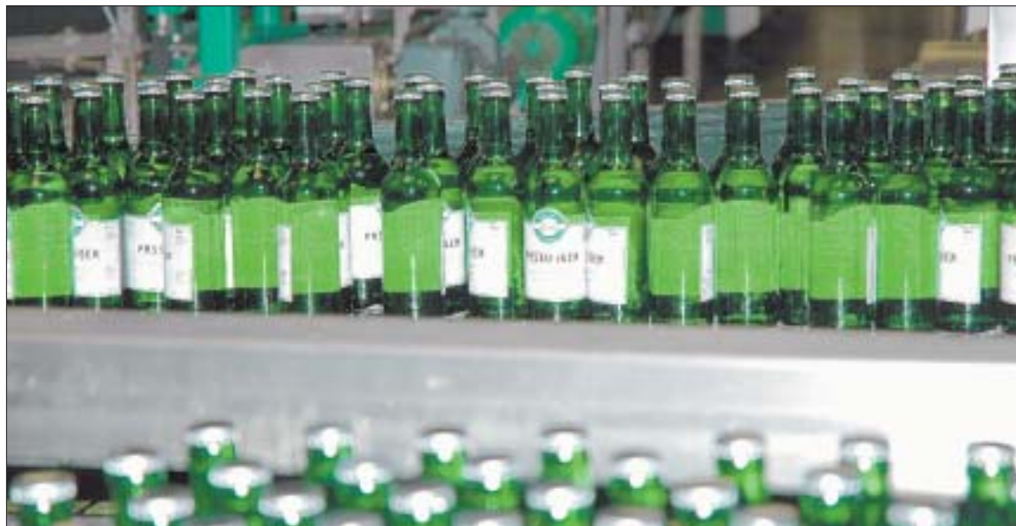
Echtes Bündner Mineralwasser: Passugger will sich im Mineralwasserhandel mit Qualität, Image und Service als eigenständiges Unternehmen behaupten.