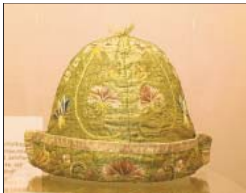
Eine Vielfalt von Hüten kann im Rätischen Museum bestaunt werden. (tam)

Das Rätische Museum in Chur widmet sich den wichtigsten Accessoires der Kostümgeschichte: Ab heute Freitag bis zum 18. März werden historische und zeitgenössische Kopfbedeckungen präsentiert. Es geht um Schutz, Mode